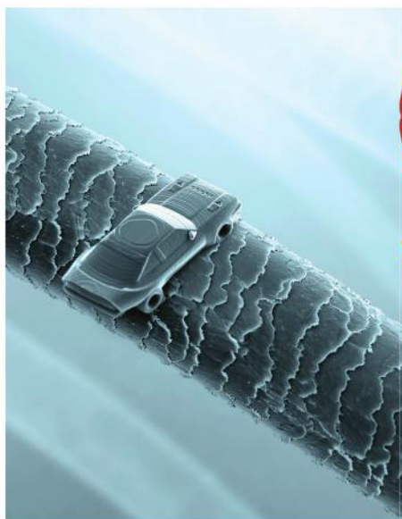
Do plastu umí zhotovit i auto menší než vlas.

„Na plochu jednoho centimetru čtverečního dokážeme vtisknout třeba knihu o tisíci stranách. A třeba na straně číslo 738 uděláme v jednom slově záměrnou chybičku, o níž víme jen my a zákazník, padělatel